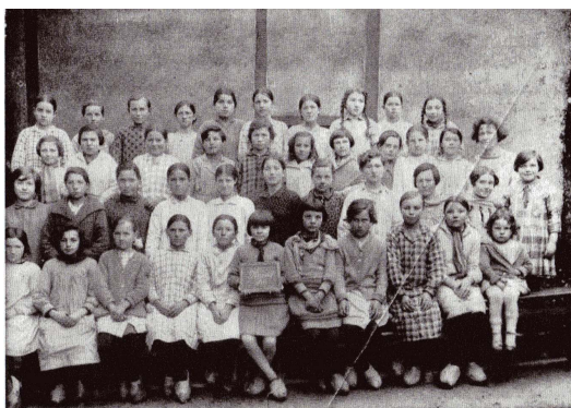
Classe de 1930 (route d'Audierne)