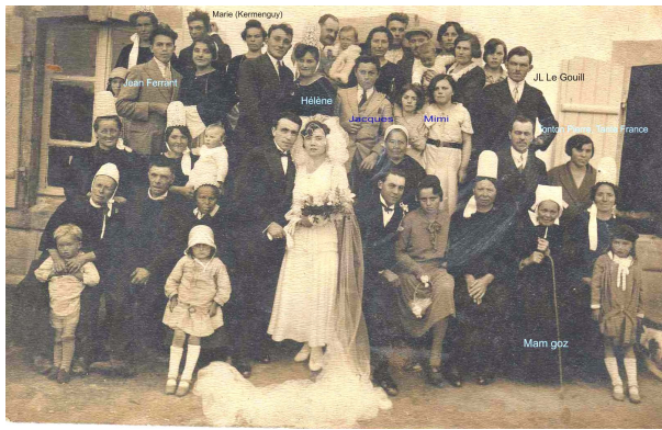
mariage à Plozévet en 1931