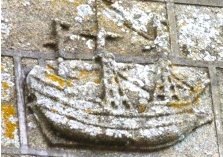
Barque sculptée- Eglise d'Audierne -17ème

Au matin de ce 11 août 1723, le Bienheureux St Jean, barque de Morlaix , vient de doubler la pointe du Raz et s'approche de Penmarc'h.