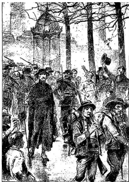
LES BRETONS A PARIS Dessin au crayon de M. Ad. Léfant.