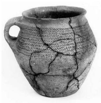
Vase en céramique provenant du tumulus de Kervern.