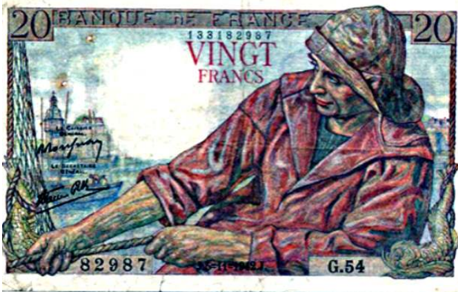
Billet de 20F _1942