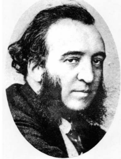
Jules Ferry (1832-1893)

Il avait pour but d'améliorer la fréquentation scolaire et le zèle des élèves et des maîtres, mais il ne sera véritablement institué que sous la Troisième République par le ministre de l'Instruction publique, Jules Ferry, en 1882.