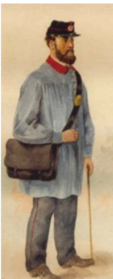
Facteur rural 1900.