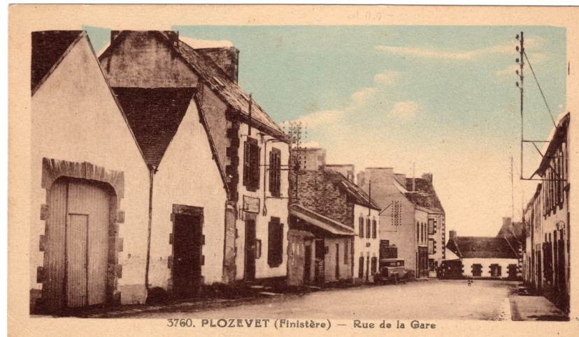
La poste est restée longtemps dans la maison que l'on voit à gauche de l'image.