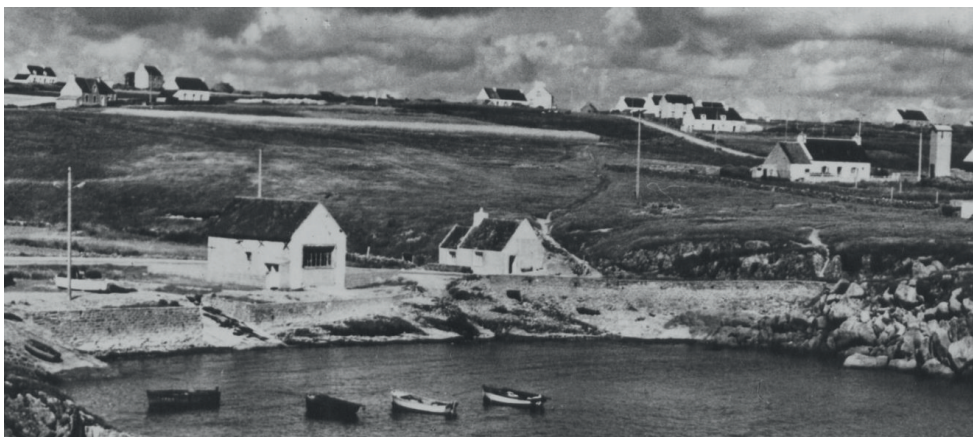
La route de Lestréouzien se distingue, blanche, au second plan. Page 2

Ils cassaient des tas de cailloux avec de lourds marteaux. Un rouleau les tassait sur la chaussée.