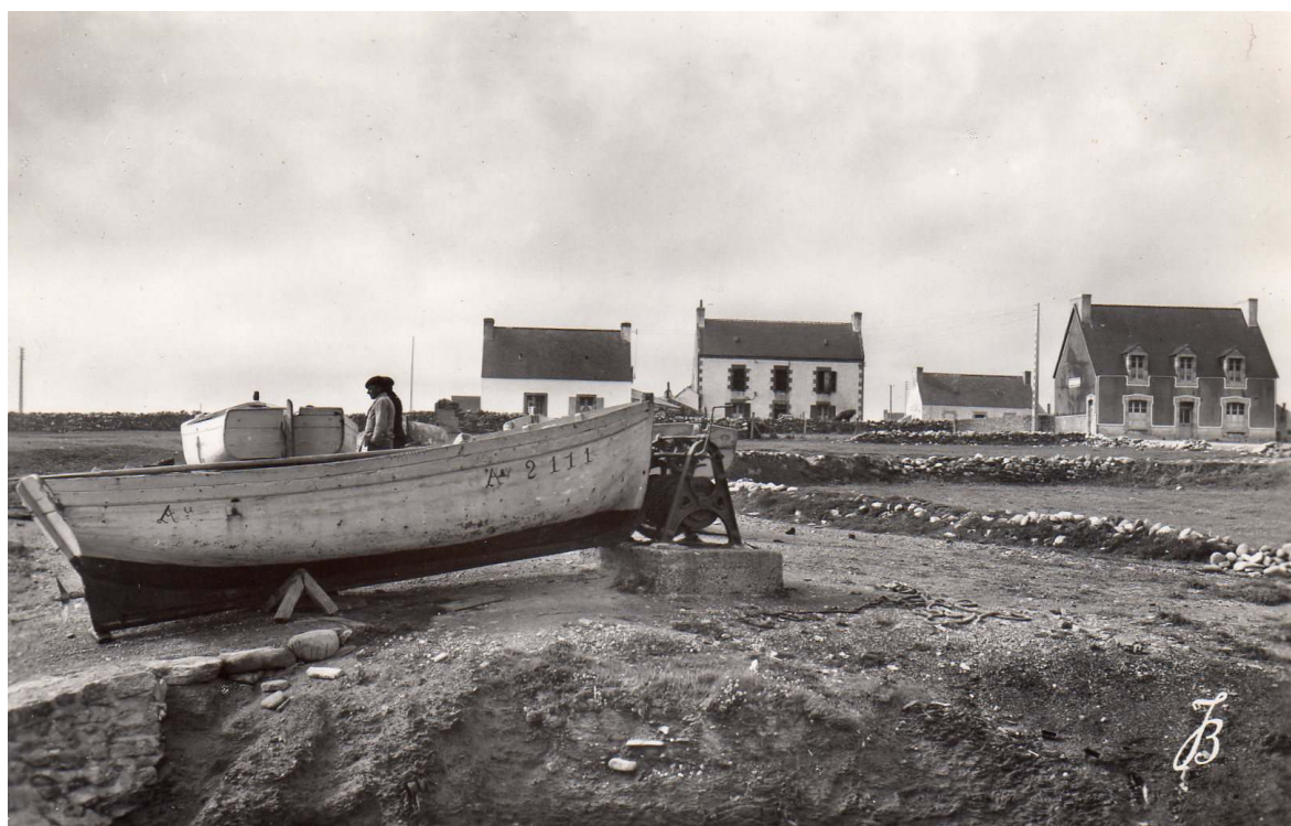
Penhors vu par Jean Bourdon_années 50