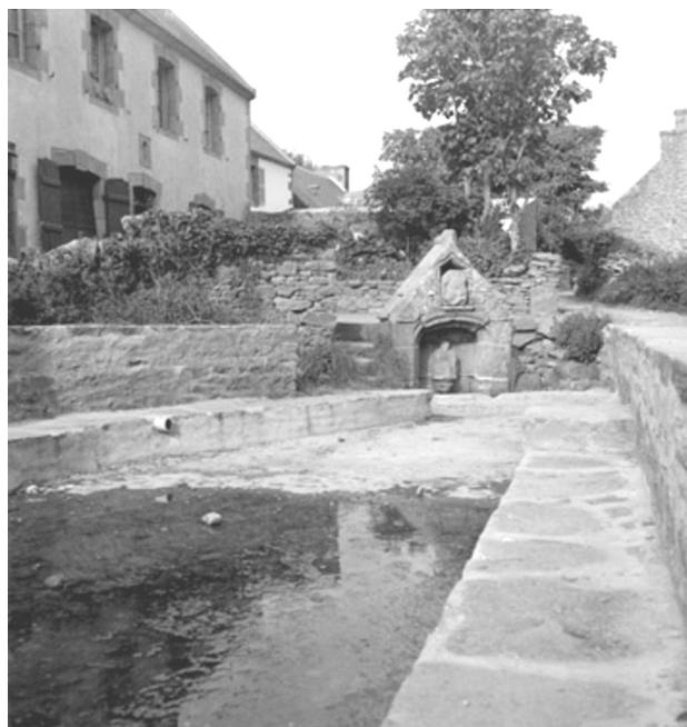
Collecte 1939