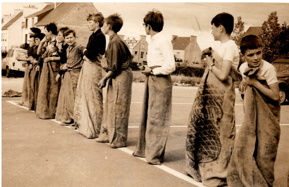
Plus tard (années 60) la place bitumée est utilisée pour les fêtes de septembre et pour le marché mensuel. La foire à peu à peu disparu.