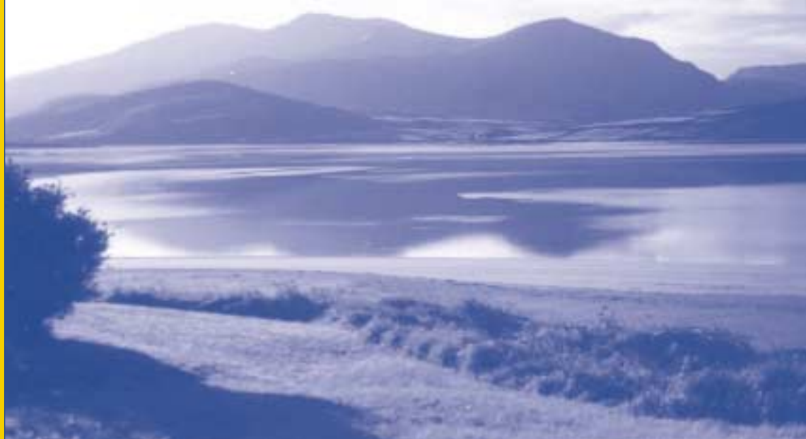
La Baie de Brandon.