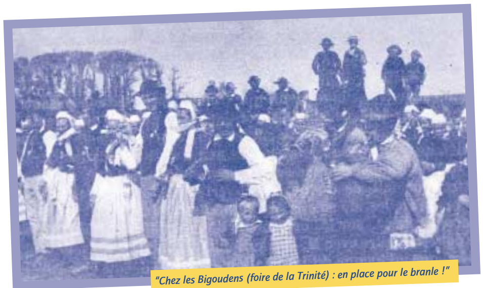
"Chez les Bigoudens (foire de la Trinité) : en place pour le branle !"

Dans ce court ouvrage, dont un des rares exemplaires se trouve à la Bibliothèque Municipale de Quimper (Cote FB 1102), Austin de Croze affirme avoir rencontré en Cornouaille, au cours des dernières années du XIXème siècle : «fétichisme et non pas