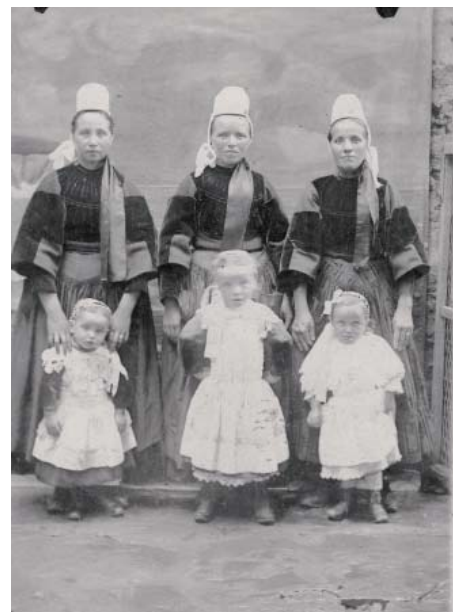
Photo ci-dessus : Veuves avec leurs enfants. Elles restaient veuves à 33 ans.