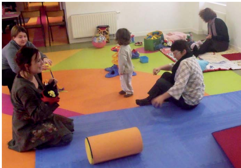
Photo ci-dessus : l'éveil au breton commence dès le plus jeune âge

En effet, la langue bretonne est partout y compris dans les noms de lieux et