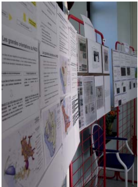
Photo ci-dessus : les panneaux expliquant le PADD ont été exposés à la mairie

Tous les plozévétiens ont ainsi pu prendre connaissance des comptes rendus des réunions publiques, des dossiers présentant les zones humides, des projets d'orientations, du zonage d'assainissement et du diagnostic agricole.