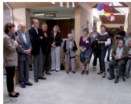
Photo ci-dessus : la Résidence de la Trinité vient de fêter ses 25 ans