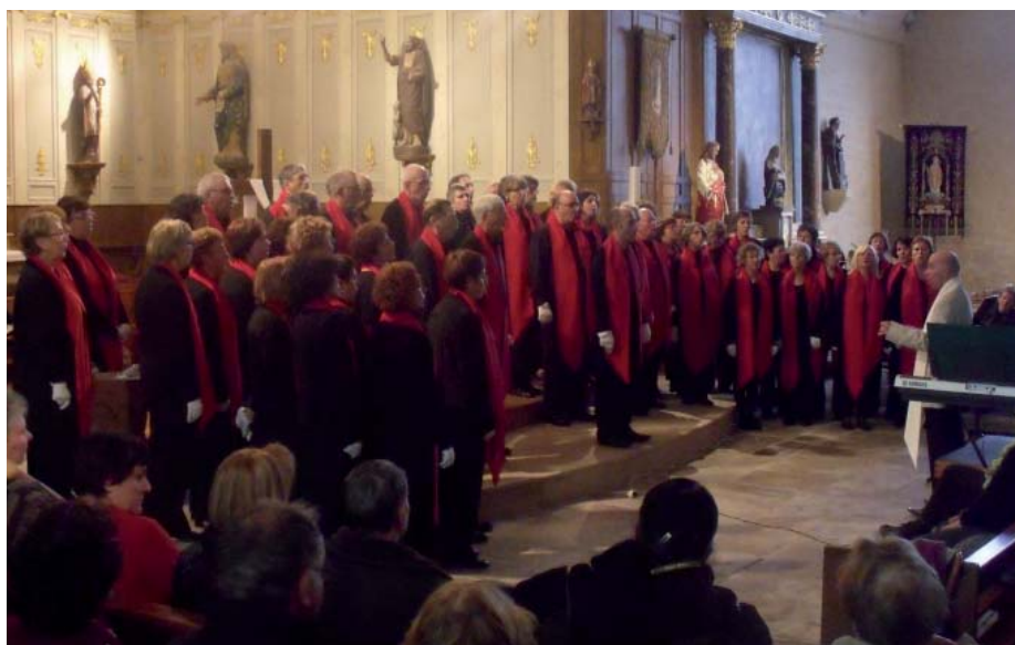
Photo ci-dessus : la chorale Fa Dièse a donné un concert gospel dans une église de St Démet comble

chœur qui reviendront sans doute à Plozévet, présenter de nouvelles œuvres. À l'issue de sa prestation,