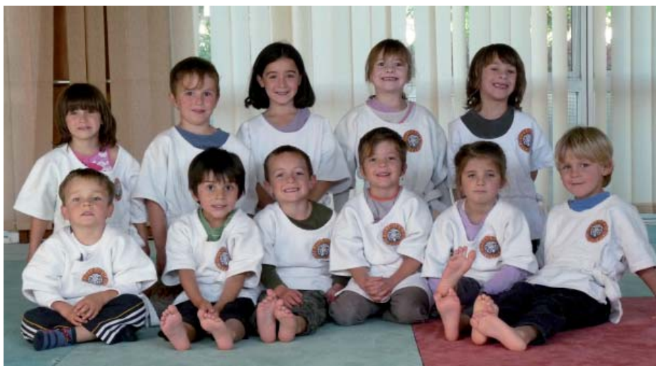
Photo ci-dessus : les enfants de 7 à 12 ans vêtus de la traditionnelle roched

Toute violence en combat est sanctionnée : il est interdit de frapper son adversaire, de forcer sur une articulation, d'étrangler. Une prise mal contrôlée peut être sanctionnée si elle a mis l'adversaire en danger. Toute violence verbale envers l'adversaire ou un des arbitres est sévèrement