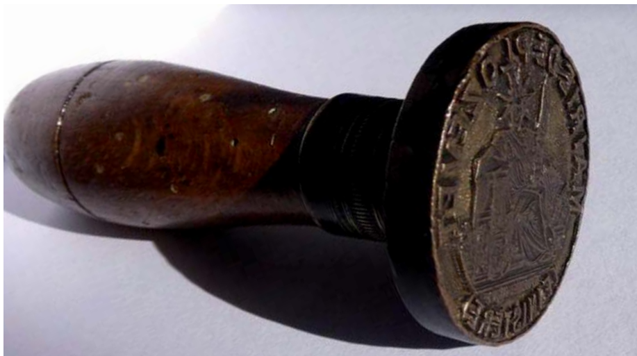
Photo ci-contre : la Marianne vient d'être restituée à la Mairie de Plozévet

* Dans la mythologie romaine, Junon est la reine des dieux et la reine du ciel.