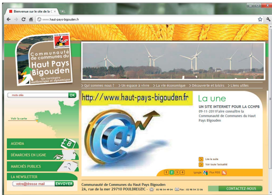
Photo ci-dessus : la page d'accueil du site www.haut-pays-bigouden.fr

Vous y verrez comment et pourquoi le Haut Pays Bigouden est un territoire dynamique et attractif, ouvert sur l'extérieur. Bonne visite ! ■