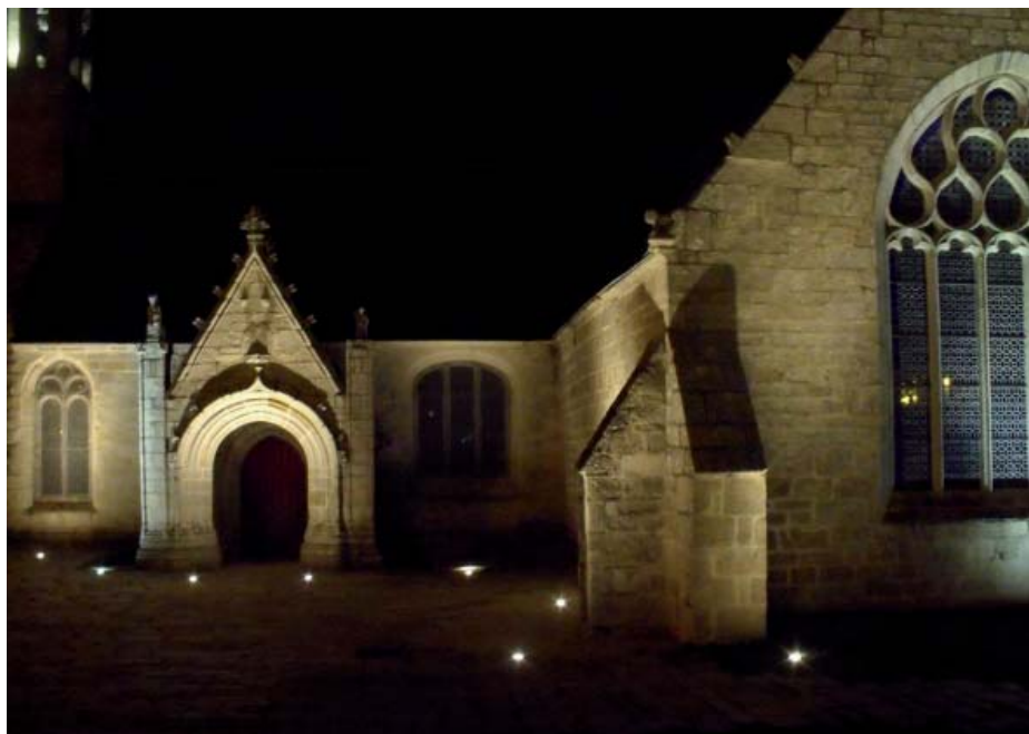
Photo ci-dessus : les projecteurs encastrés mettent l'édifice en valeur

■ recomposer un environnement végétal dans l'ensemble de l'enclos