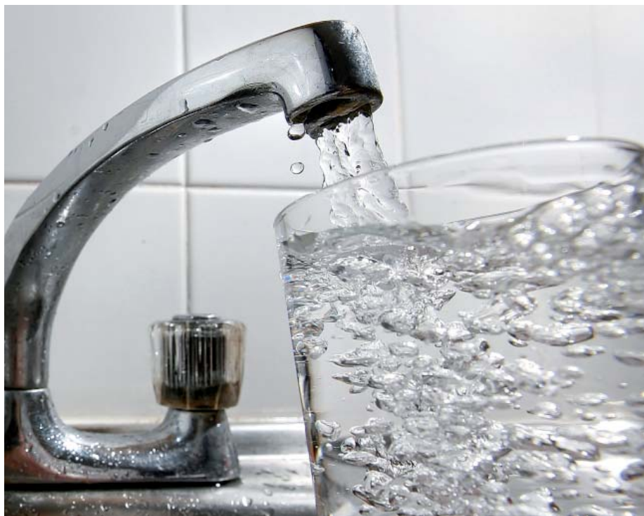
Photo ci-dessus : le taux de nitrates dans l'eau est régulièrement contrôlé

dégradation des nitrates) peut poser problème pour les nourrissons de moins de six mois, qui ne possèdent pas encore l'enzyme que l'on retrouve dans l'acidité gastrique. C'est cet enzyme qui empêche la flore bactérienne de transformer les nitrates.