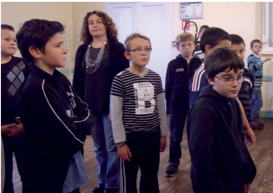
Photo ci-dessus : les élèves de CM2 de l'école Georges Le Bail ont participé à des exercices théâtraux autour du thème de l'esclavage. Six d'entre eux ont été figurants dans le spectacle.

"C'est quoi être esclave ? C'est quoi être libre ?" ■