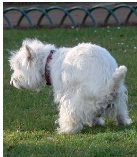
Photo ci-dessus : les propriétaires sont tenus de procéder au ramassage des déjections de leur chien

Enfin, les sanctions sont prévues par le code pénal (article 131-13) et