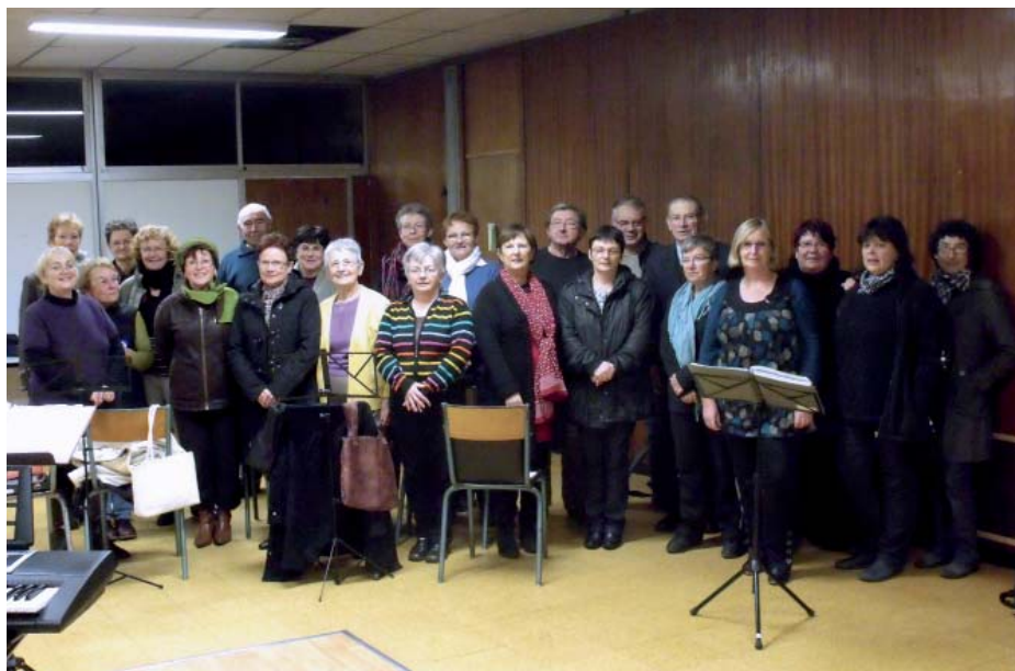
Photo ci-dessus : le répertoire de la trentaine de choristes d'Awen s'est enrichi de nombreux chants traditionnels