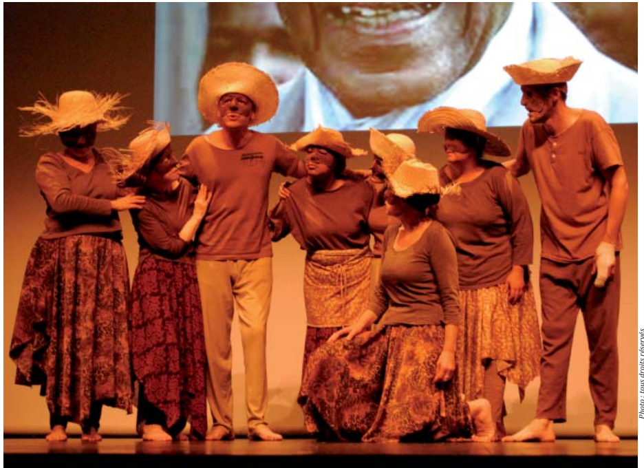
Photo ci-dessus : une représentation du spectacle "Esclaves" a été donnée le 18 novembre 2011 à l'Avel-Dro par l'association Marmelade-Théâtre

Il s'agissait aussi de mettre en lumière la résistance de citoyens blancs métropolitains tels que Schoelcher, un simple fabricant alsacien de porcelaines, qui s'est indigné de cette situation inhumaine et s'est battu pour l'abolition ; ou la résistance des esclaves tels que Toussaint Louverture, et celle de leurs descendants tels qu' Aimé Césaire ou Christiane Taubira qui ont su redonner sa dignité à leur peuple, par l'écriture ou par l'élaboration de lois.