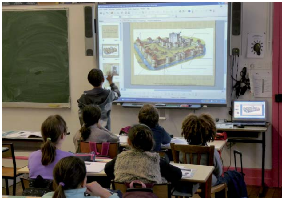
Photo ci-dessus : 4 classes de l'école Georges Le Bail sont désormais équipées de tableaux blancs interactifs

Le TBI s'accompagne d'un logiciel qui met à disposition de nombreuses fonctionnalités telles que sont l'annotation de document, la reconnaissance d'écriture et de formes géométriques, l'utilisation