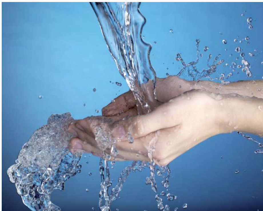
Photo ci-dessus : Le S.I.E. de Saint-Ronan souhaite informer régulièrement sur la qualité de l'eau ; les derniers relevés sont mis à jour sur le site Internet de la commune : www.plozevet.fr

■ d'un captage mis en service en 1966, pour lequel un périmètre de protection a été mis en place, dont 38ha de terres sont boisés depuis 2000. L'eau brute bénéficie d'un traitement physico-chimique et d'une désinfection. Un système de télésurveillance automatique est installé. La capacité nominale est de 73m 3 /h.