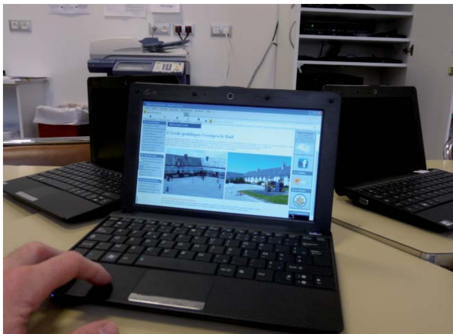
Photo ci-dessus : les élèves de l'école Georges Le Bail disposent à présent d'une quinzaine de netbooks afin de parfaire leur apprentissage de l'informatique

Une fois les travaux terminés et sauvegardés sur le serveur, les ordinateurs sont mis en charge dans la nouvelle salle des maîtres où une armoire sur mesure a été réalisée par les services techniques municipaux pour les stocker en toute sécurité. ■