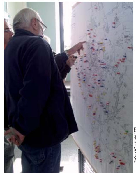
Photo ci-dessus : 300 personnes se sont déplacées à la mairie pour consulter le PADD

Enfin, vient la phase d'approbation : le dossier, éventuellement modifié suite à l'enquête publique, est présenté une dernière fois au conseil municipal pour approbation. Lorsqu'il est validé, le document qui s'impose à tous est mis à la disposition du public. ■