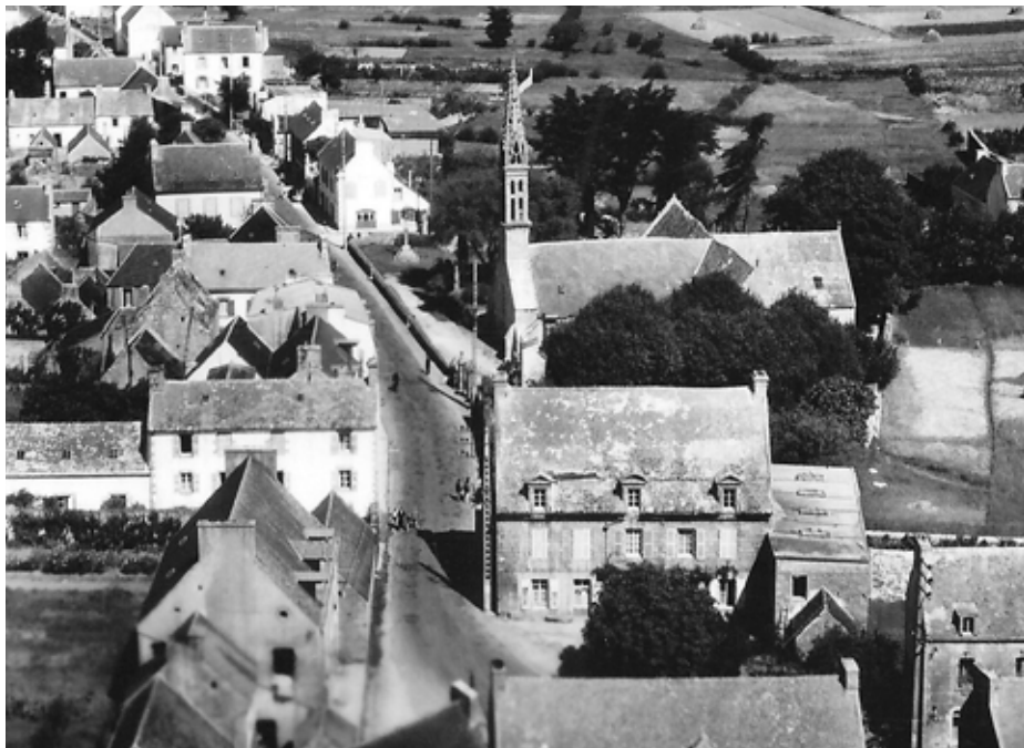
Photo ci-dessus : la maison Kérisit se situait sur l'actuelle place Henri Normand

En 1828, la maison et ses dépendances étaient entourées de murs et possédaient un grand jardin au nord, traversé par le ruisseau allant de