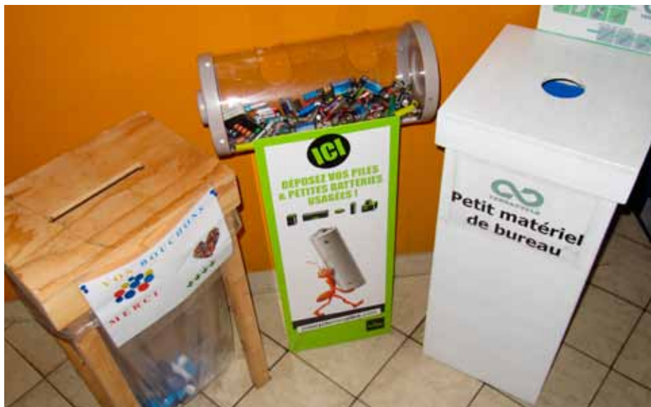
Photo ci-dessus : 3 colonnes de tri ont été installées à l'accueil de la mairie

Bouchons : l'occasion de participer à une action solidaire portée par l'association Un bouchon, un sourire. Pris en charge par les services techniques communaux, les bouchons sont déposés à l'antenne quimpéroise de l'association qui les vend à une usine de recyclage. Les bénéfices permettent d'acheter