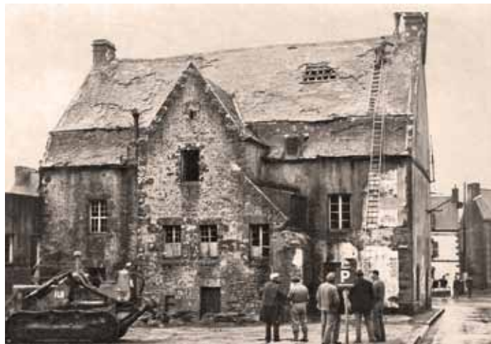
Photos ci-dessus : à gauche, la façade principale - à droite, la maison Kérisit avant sa démolition

Le temps passa, les ardoises se détachèrent et la belle demeure fut baptisée "verrue".