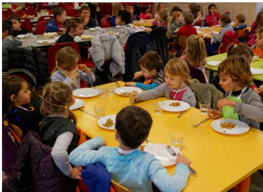
Photo ci-contre : 185 repas sont servis chaque jour au restaurant scolaire

Comme l'an dernier, de nombreux projets jalonnent l'année : découverte de l'Asie, rencontres intergénérationnelles... C'est dans ce cadre que les fresques réalisées par les enfants sur les murs de l'école en juin 2014 ont pu être inaugurées le 4 septembre dernier par le Maire pour la plus grande fierté des enfants et des animateurs... ■