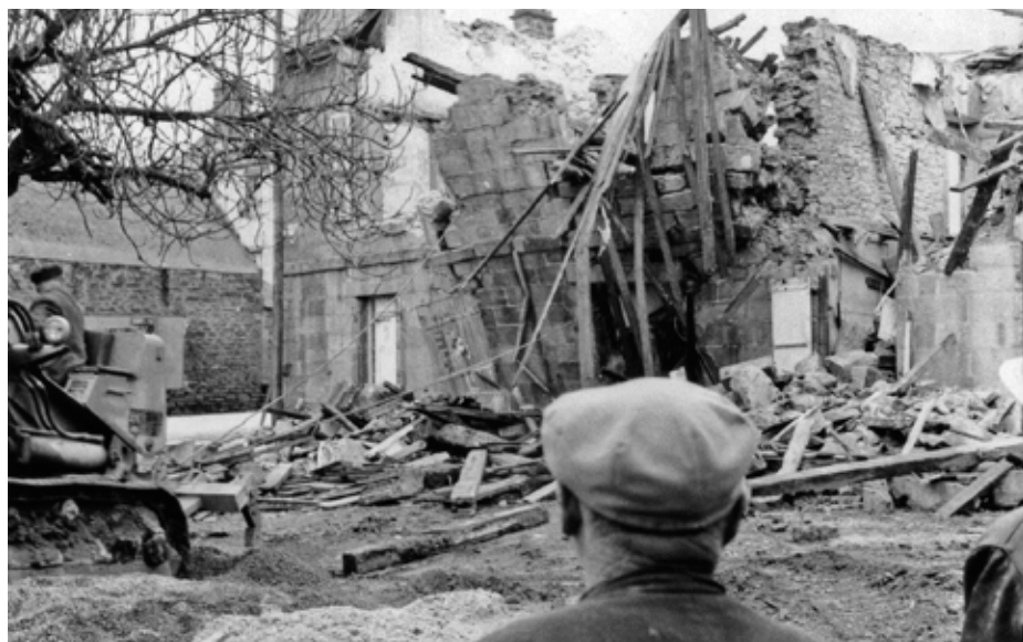
Photo ci-dessus : à gauche, la municipalité racheta la maison en 1962 - à droite, la démolition débuta le 14 février 1964