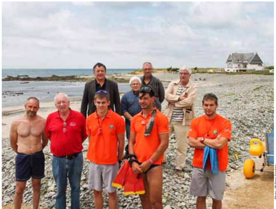
Photo ci-dessus : la SNSM assure la surveillance des zones de baignade l'été sur les plages de la CCHPB, comme ici à Kerrest

Les candidatures sont proposées par la SNSM qui assure la formation des équipes.