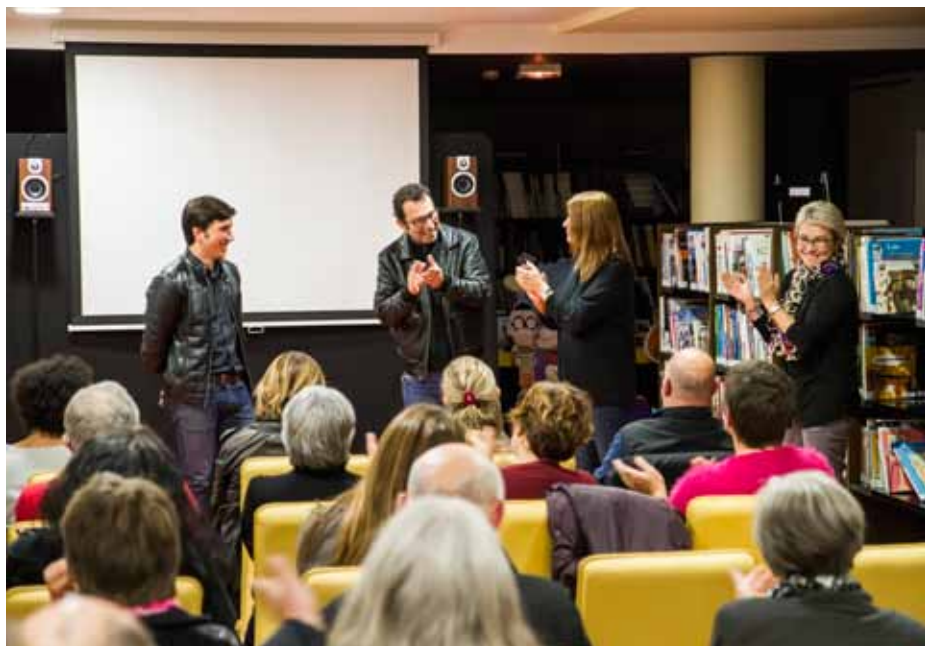
Photo ci-dessus : la projection du film JSDM a été suivie d'un débat passionné

Dès janvier, à l'initiative d'Histoire et patrimoine, 5 panneaux retraçant en photos l'histoire des grandes fêtes de l'école Georges Le Bail, des années 1930 à 1990 seront exposés,