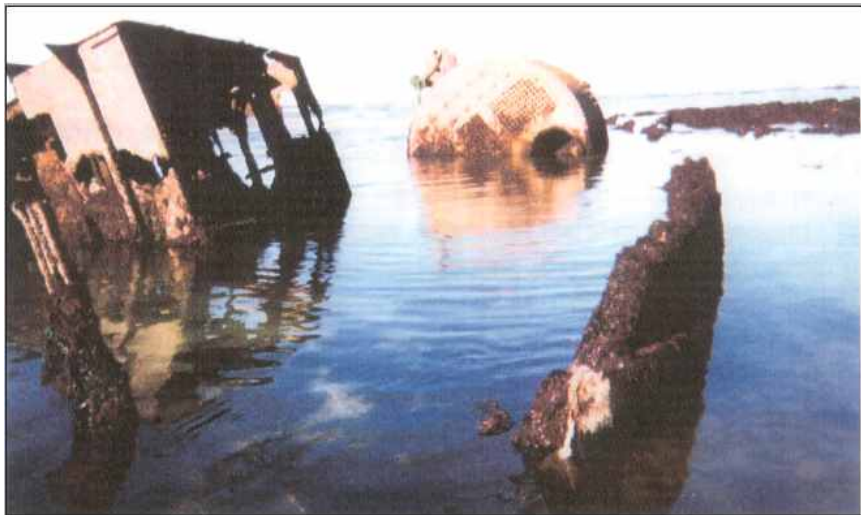
L'épave en 2004, à marée basse.